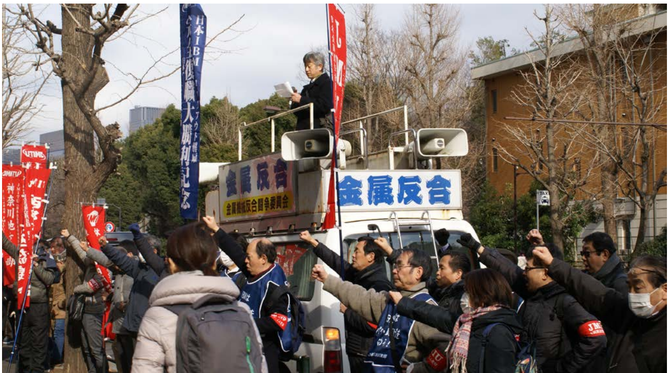
19春闘勝利へ、中央行動 (2月13日・厚生労働省前)

JMITUは19春闘統一要求日の2月20日、全国で143支部分会がいっせいに要求を提出しました。要求額平均は2万9,916円(10.88%)。昨年比で2,500円上回っています。